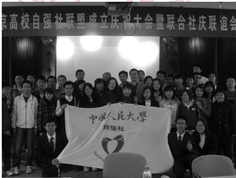
北京高校自强社联盟社庆合影