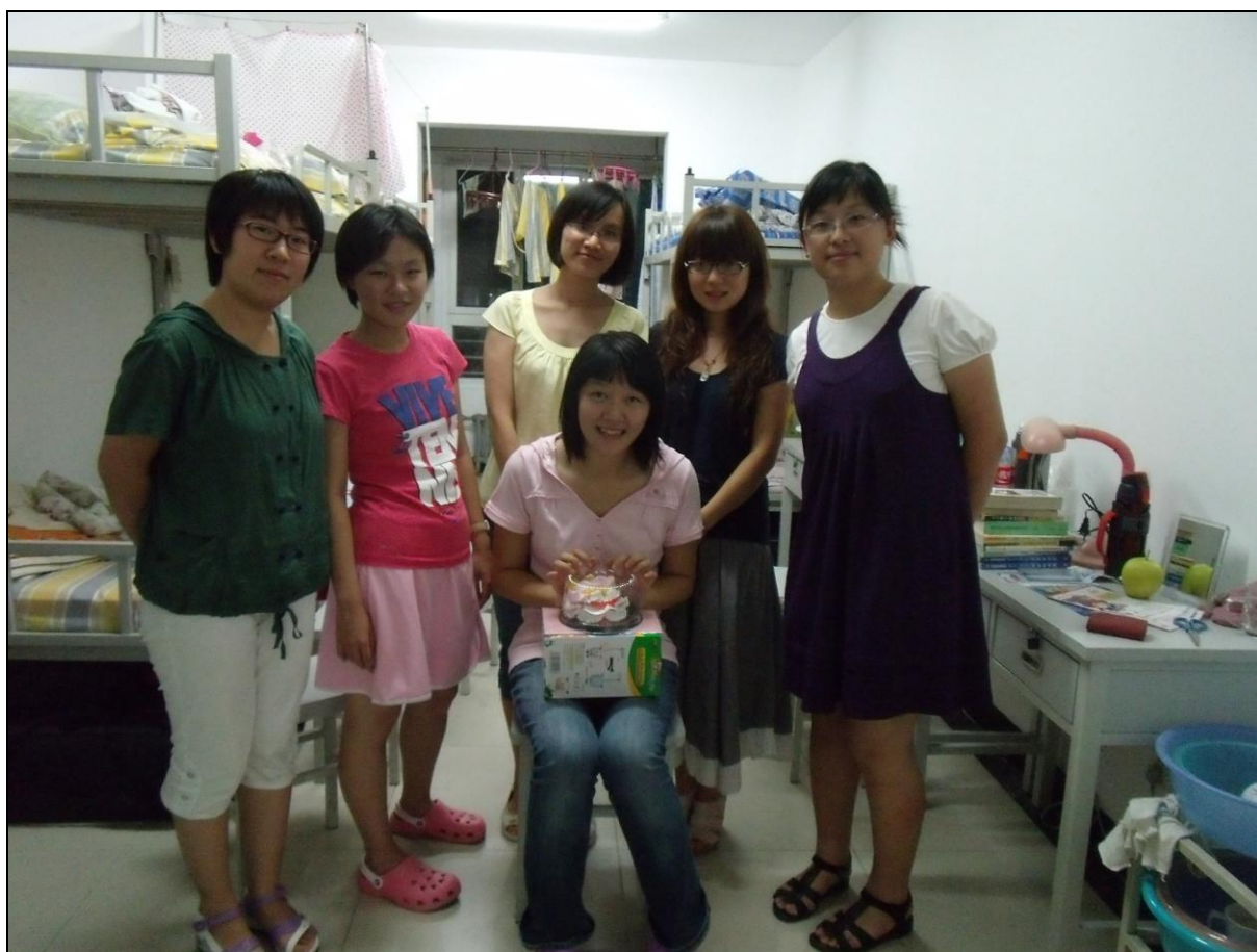
图片：公寓辅导员为 314 过生日同学送上祝福（9 月 7 日）

金秋十月，知行四楼将于 10 月 25 日迎来第一次公寓安全文明卫生检查。 如果你的宿舍干净整洁，那么恭喜你，本次卫生检查你的宿舍基本通过； 如果你的宿舍干净整洁温馨，有一点家的味道，那么祝贺你，本月优秀宿舍就是你们的；