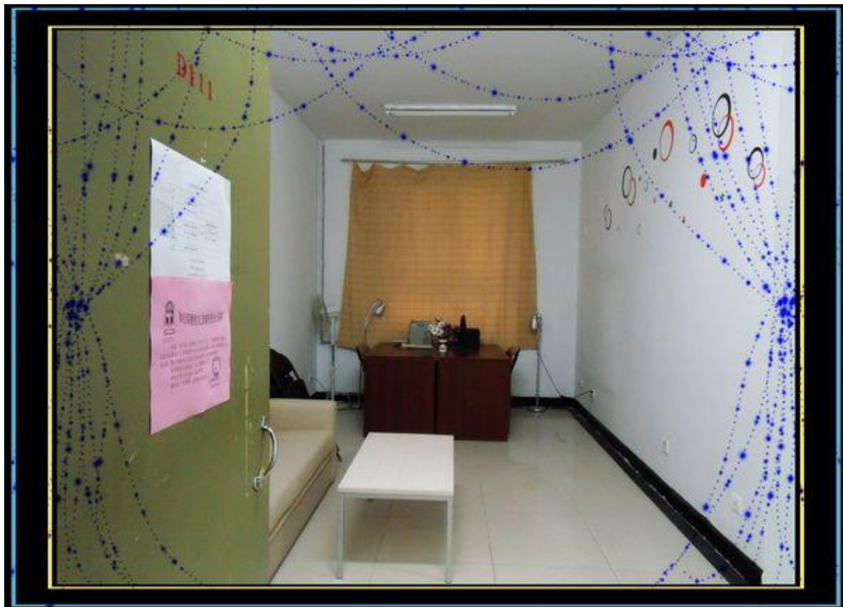
知行四楼辅导员工作室： 111