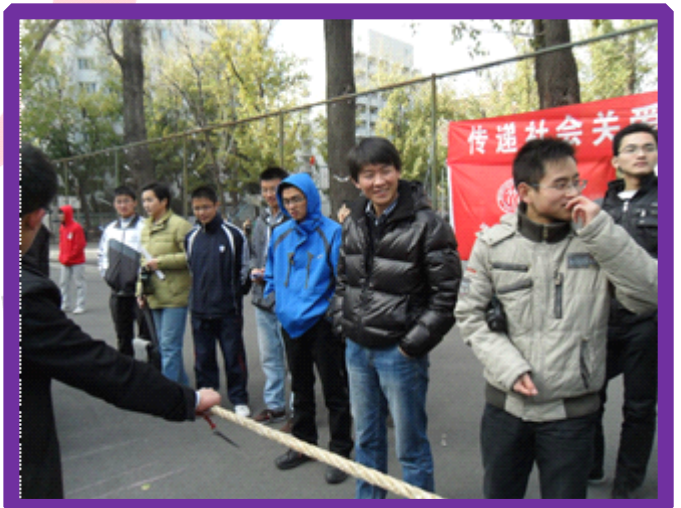
光说不练假把式哈…