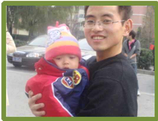
你笑得是挺 high…但是孩子呢