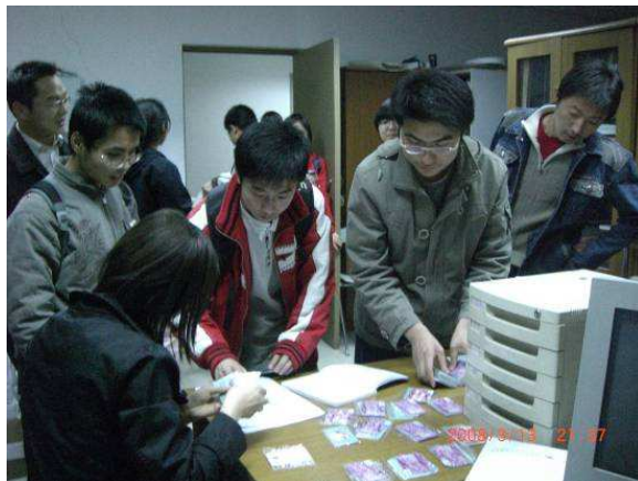
社员们接受“爱心电话卡”

从2008年3月9号开始，中国人民大学自强社和本校学生处联合举办“生活联络员”调查活动。该活动是在本校学生处的指导下开展的，主要是让本社社员担当学生处和人大学生之间的桥梁。联络员的任务是及时向学生处反映周围同学的生活负担情况，特别是困难学生的生活学习情况，同时留心周围是否有遇到生活困难急需帮助的同学。该活动已经