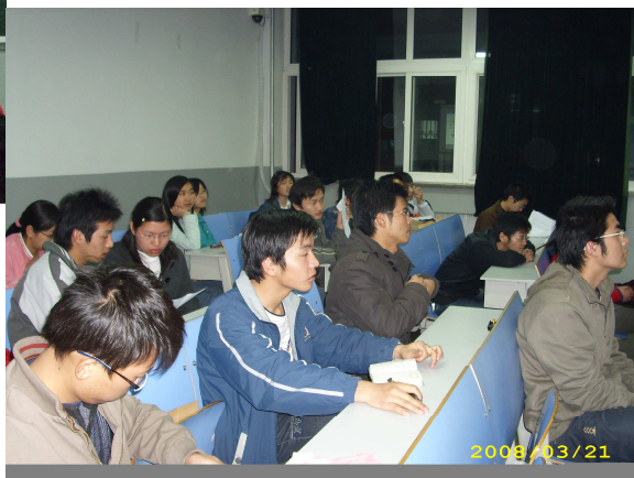
社员们正在认真听讲

首先，黄道余社长对过去的工作做了总结和肯定，对近期自强社的具体工作和方向做了初步规划，要求社