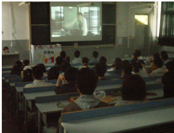
同学们正在认真听讲

弗莱彻是个炙手可热的大律师，他追求的物质生活，跟他在法庭上追求的真相一样：一切都能以金钱来衡量。事实对他来说，远不及有力的辩词来得重要，于是他为了胜诉，在法庭上说谎骗人，丝毫不以为意。久而久之，他在日常生活上也变得口是心非，成为不可救药的大骗子。就连他和前妻所生的5岁小儿子麦克斯，都对他的谎言