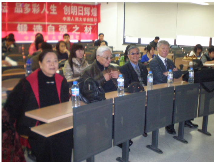
慈祥和蔼的四位老人

下午两点半，伴随着一阵热烈的掌声，四位鹤发童颜的老人来到了同学们面前。老人们虽然长途奔波而