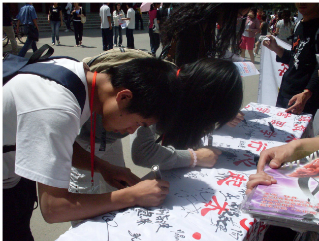
同学们积极签名 争做诚信人

“做诚信学子，建和谐人大”，宣扬诚信这一中华民族优秀的传统美德。受到诚信的感召，同学们都踊跃地在我们准备好的白色长绢上留下了自己的名字，并激动地表示：一定要做诚实守信的人。不仅为学校，更是在 08 奥运来临之际，为祖国赢得尊敬和信任。