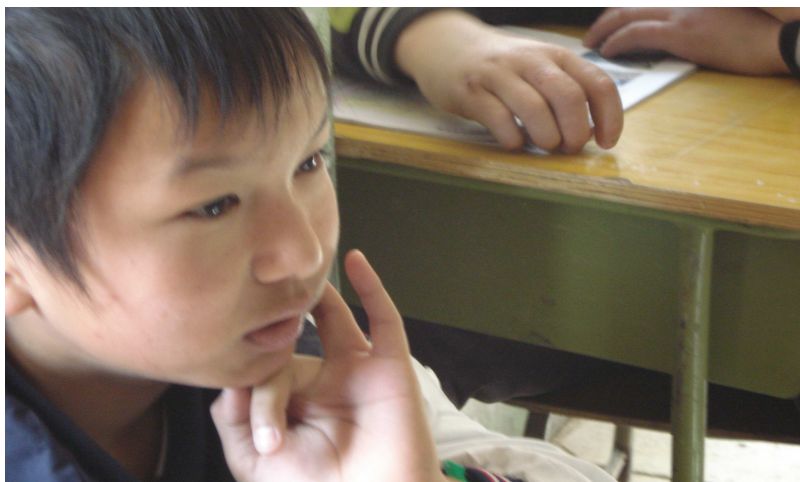
小同学认真听着小老师们讲课

中午1点半左右，支教小组集合出发。作为自强社的一员，本着“传递社会关爱、锻造自强之才”的精神，每位同学都想为这个社会尽一份绵薄之力。所以，